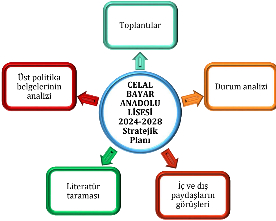
Şekil 1: Stratejik Plan Oluşum Şeması

2024-2028 Stratejik Plan çalışmalarının başladığı 06/10/2022 tarihinde Millî Eğitim Bakanlığı Strateji Geliştirme Başkanlığı tarafından onaylanan ve yayımlanan 2022/21 sayılı genelge ile müdürlüğümüz birimlerine duyurulmuştur. Birimlerin çalışmalara azami katılım ve desteklerinin, açıklama yazısı ve ekler doğrultusundaki dokümanlardan faydalanılarak yapılması sağlanmıştır.